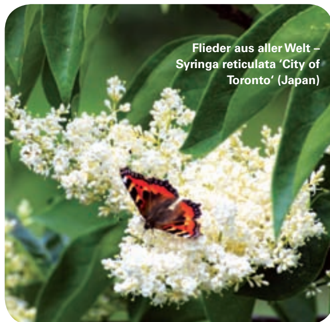
Flieder aus aller Welt – Syringa reticulata 'City of Toronto' (Japan)

Flieder gehört zum Mai wie die Liebe und der kurze Rock. Am sinnlichsten ist er in den Abendstunden, wenn er seine Düfte in die Welt schickt. Es gibt übrigens mehr Fliedersorten, als man denkt.