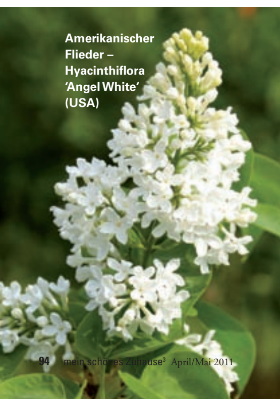
Amerikanischer Flieder – Hyacinthiflora 'Angel White' (USA)